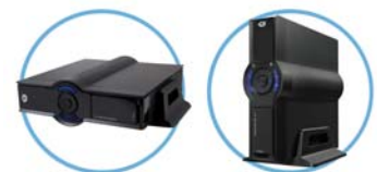
liegend oder stehend aufstellbar

* Video-/Filmunterstützung hängt von den verwendeten CODECs ab.